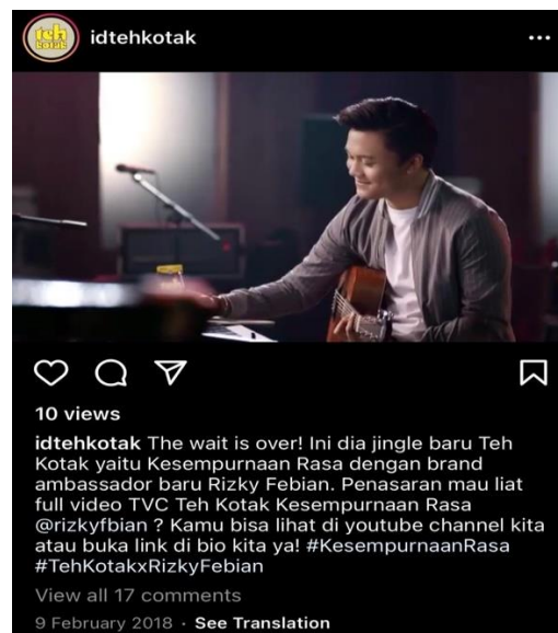
Gambar 1.7 Brand Ambassador Teh Kotak