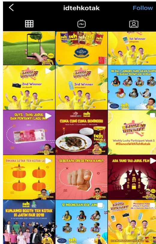
Gambar 1.6 Feeds Instagram Teh Kotak