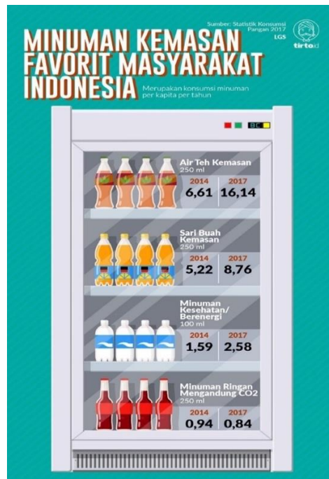
Gambar 1.4 Data Minuman Kemasan Favorit Masyarakat Indonesia

Berdasarkan data Nielsen Indonesia, sepanjang Januari-Agustus 2019 penjualan teh dalam kemasan mencapai Rp12,37 triliun. Capaian itu tumbuh dari periode yang pada 2018 yang mencatatkan penjualan Rp11,96 triliun dan 2017 sebesar Rp11,81 triliun. Direktur Pelaksana Nielsen Indonesia Agus Nurudin memperkirakan industri teh dalam kemasan masih akan melanjutkan pertumbuhan penjualan dan industrinya dalam beberapa tahun ke depan. Hal serupa terjadi pada industri air mineral, susu cair dan minuman mengandung buah-buahan. (Bisnis.com, 2019)