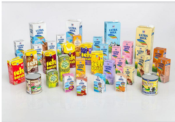
Gambar 1.1 Produk-produk PT Ultrajaya Milk Industry Tbk

PT. Ultrajaya Milk Industry Tbk. merupakan salah satu perusahaan yang bisnis utamanya yakni sebagai produsen minuman terkemuka di Indonesia. Pada awal berdirinya, perusahaan ini merupakan sebuah industri rumah tangga sederhana yang dimulai pada tahun 1958 di Bandung, Jawa Barat. Selanjutnya industri sederhana yang dirintis oleh seorang pengusaha Tionghoa bernama Ahmad Prawirawidjaja ini berkembang menjadi perseroan terbatas sejak tahun 1971. Reputasi perusahaan ini sebagai pelopor minuman dalam kemasan di Indonesia membuat Ultrajaya Milk tetap diterima di tengah konsumen Indonesia dengan baik.