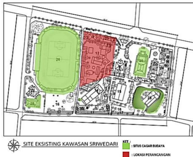
Gambar 1 .1. Peta Eksisting Lokasi Perancangan