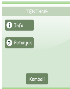
Gambar 3.7 Tampilan Menu Tentang