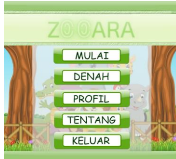
Gambar 3.3 Tampilan Menu Utama