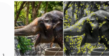
Gambar 2. 1 Marker AR

Marker merupakan sebuah penanda khusus yang memiliki pola tertentu sehingga saat kamera mendeteksi Marker , objek 3 dimensi dapat ditampilkan. Metode marker merupakan metode yang memanfaatkan marker (penanda) berupa ilustrasi hitam putih berbentuk persegi atau ilustrasi gambar dengan warna dan bentuk tertentu [5]. Secara umum metode ini membutuhkan beberapa hal dalam pengolahannya, seperti perangkat komputer atau mobile yang dilengkapi dengan kamera dan sensor pendukung AR, aplikasi AR dan marker . Alur sistemnya yaitu aplikasi AR akan mengakses kamera perangkat kemudian sistem akan mendeteksi marker melalui kamera, lalu menampilkan objek virtual diatas marker pada layar perangkat. Contoh marker AR dapat dilihat pada gambar 2.1.