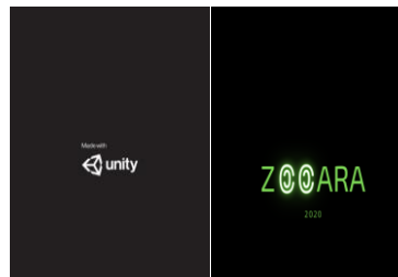
Gambar 3.2 Tampilan splash screen