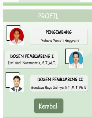
Gambar 3.6 Tampilan Menu Profil