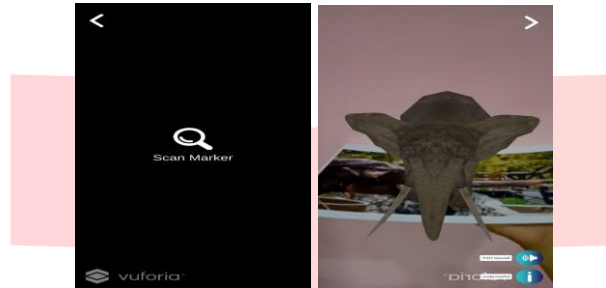
Gambar 3.4 Tampilan Menu Mulai