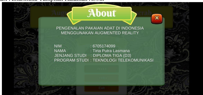
Gambar 9 Tampilan Halaman About