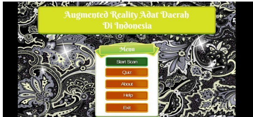
Gambar 4 Tampilan Halaman Beranda