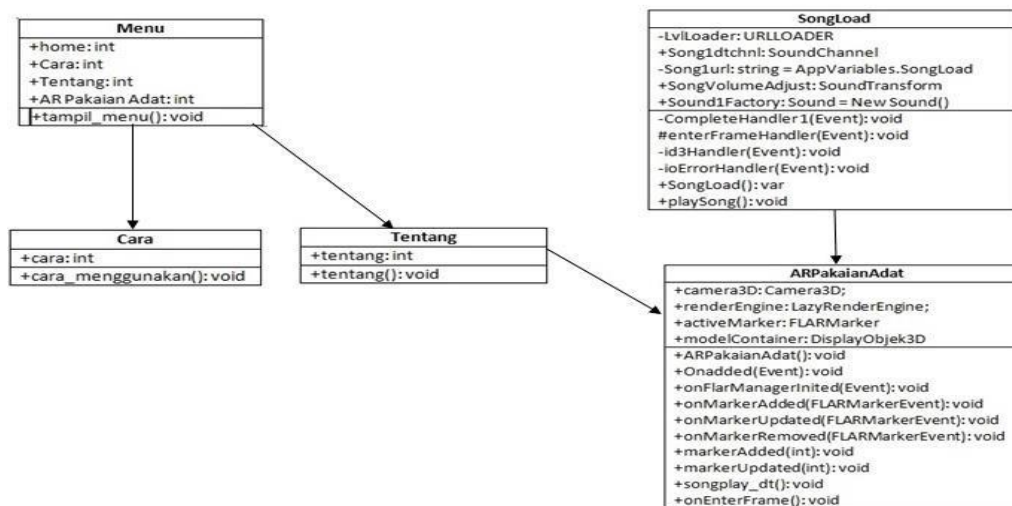
Gambar 3 Class Diagram

Class diagram adalah sebuah spesifikasi yang jika diinstansiasi akan menghasilkan sebuah objek dan merupakan inti dari pengembangan dan desain berorientasi objek. Class menggambarkan keadaan ( attribut atau property ) suatu sistem, sekaligus menawarkan layanan untuk memanipulasi keadaan tersebut (metoda atau fungsi). Gambar 3 adalah kelas diagram dari Aplikasi Multimedia Pembelajaran Pakaian Adat di Indonesia Menggunakan Augmented Reality .