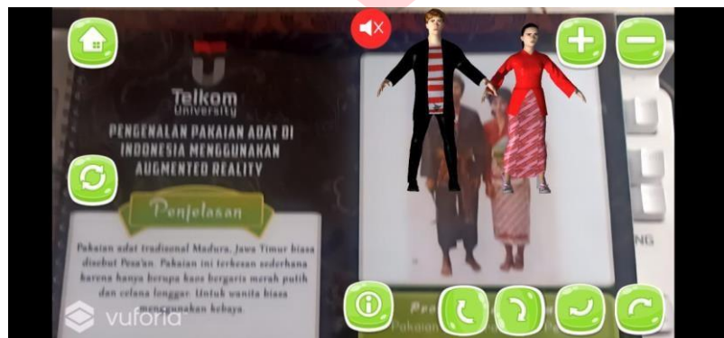
Gambar 5 Tampilan Halaman Start Scan