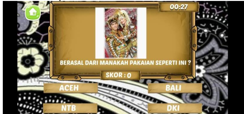
Gambar 7 Tampilan Halaman Soal-soal