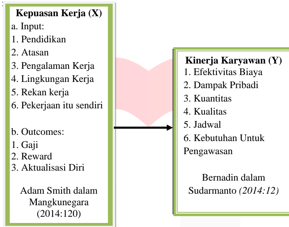
Gambar 1: Kerangka Pemikiran

Berdasarkan penjelasan dari uraian teoritis di atas, kerangka konseptual dari penelitian yang dilakukan dijabarkan dibawah ini: