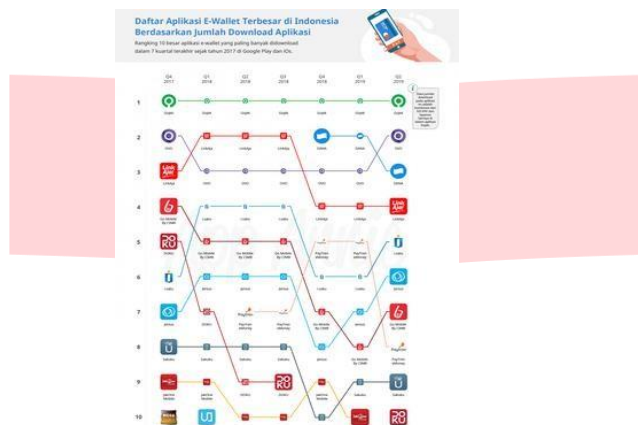
Gambar 1.3 Unduhan Dompot Digital di Indonesia

Menurut laporan riset Kompas Tekno pada 10 aplikasi dompet digital yang menggunakan metode perhitungan dengan variabel jumlah unduhan aplikasi di IOS, App Store, dan Google Play Store. LinkAja menempati posisi ke empat, setelah Go-Pay, Ovo, dan Dana. Secara garis besar aplikasi dompet digital buatan pengembang lokal masih mendominasi metode pembayaran cashless di Tanah Air. Secara berurutan diduduki oleh Go-Pay, Ovo, Dana, LinkAja, i.saku, Jenius, Go Mobile by CIMB, Paytren, Sakuku, dan Doku.