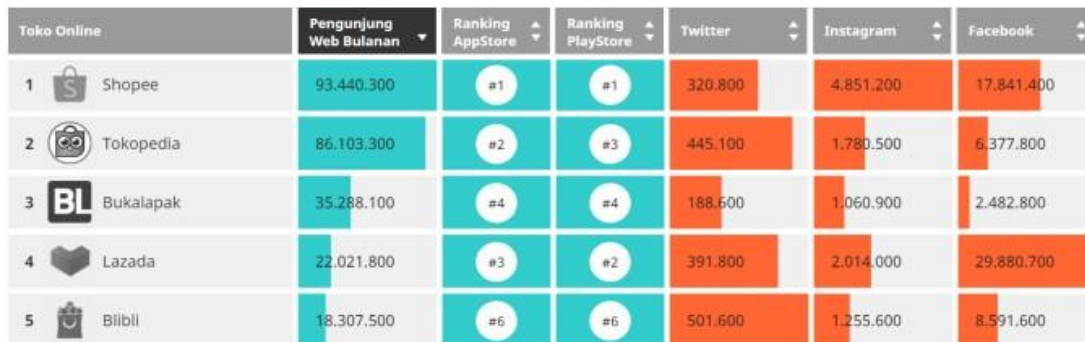
Gambar 1.1 Persaingan E-Commerce Di Indonesia

mudah konsumen untuk mendapatkan sesuatu melalui online. E-commerce merupakan salah satu platform yang bisa digunakan konsumen untuk mendapatkan barang yang diinginkan melalui online.