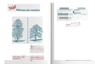
Gambar 4.6 Halaman isi zine Ngopi Apa Hari Ini