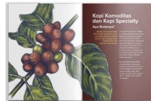
Gambar 4.5 Halaman isi zine Ngopi Apa Hari Ini