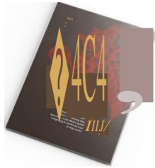
Gambar 5.1 Halaman isi zine