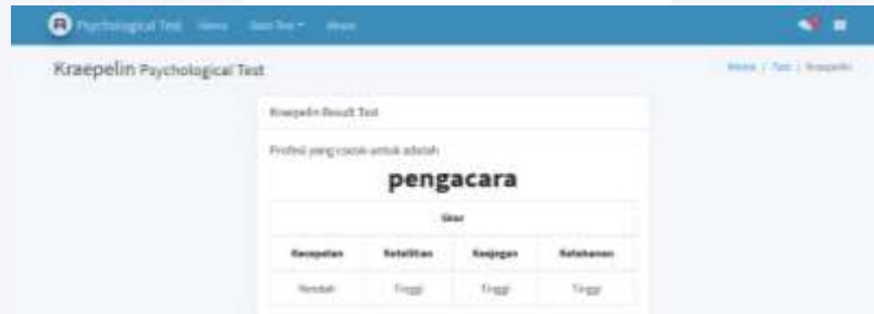
Gambar 3.5 Contoh Hasil Tes Kraepelin

Pengujian ini dilakukan kepada 30 responden dengan cara mengerjakan tes psikologi Kraepelin. Setelah pengguna telah selesai mengerjakan tes psikologi Kraepelin, data hasil jawaban pengguna akan dibandingkan dengan dataset menggunakan metode Naïve Bayes . Berikut merupakan contoh hasil tes yang didapatkan oleh responden.