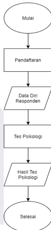
Gambar 3.2 Flowchart

Flowchart yang ada pada aplikasi ini akan berisi flowchart sistem keseluruhan dan alur pada proses pengacakan soal. Alur sistem secara keseluruhan dapat dilihat pada gambar berikut ini: