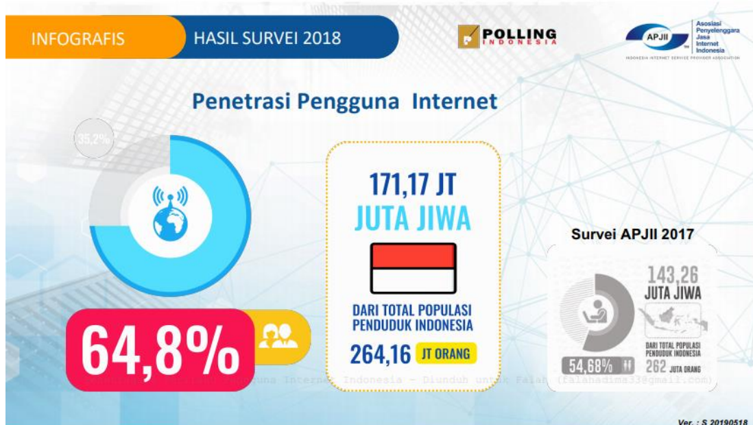
Gambar I.1 Data Pengguna Internet Tahun 2018

Pada laporan Hasil survei Asosiasi Penyelenggara Jasa Internet Indonesia (APJII) tahun 2018 mencatat 171,17 juta jiwa atau 64,8 persen pengguna internet dari total penduduk indonesia sebanyak 264,16 juta orang. Pada tahun 2017, jumlah pengguna internet Indonesia, menurut survei yang sama dilakukan APJII, mencapai 143,26 juta dari total penduduk indonesia sebanyak 262 juta orang. Artinya, dalam tempo satu tahun, tercipta pertumbuhan pengguna mencapai 27,91 juta dan dapat disimpulkan bahwa penggunaan internet dari 2017 sampai 2018 mengalami kenaikan yang signifikan.