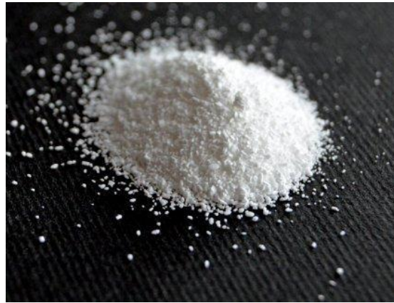
Gambar 6 Soda Ash

Soda Ash atau Natrium Carbonate Na_2CO_3 adalah salah satu zat kimia yang bersifat basa yang mudah larut dalam air dan bisa digunakan untuk menaikkan pH air. Kenapa menggunakan soda ash untuk menaikkan pH?