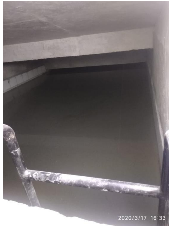
Gambar 1 Rainwater Tank

Rainwater tank adalah penampung air yang bersumber dari air hujan. Air hujan ditangkap di atap bangunan dan dialirkan ke rainwater tank untuk ditampung dan dimanfaatkan kemudian air hujan ini dibersihkan dari sampah mikro yang terbawa dari atap.