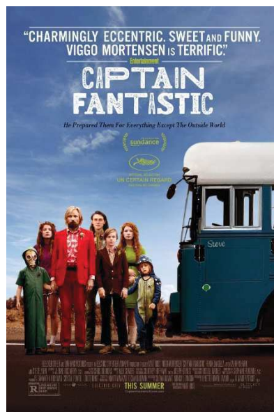
Gambar 1.1 Poster Film “Captain Fantastic”

Oscar 2017 pada Februari 2017, kategori “ Best Performance by an Actor in a Motion Picture – Drama ” dalam acara penghargaan Golden Globe 2017 pada Januari 2017, dan kategori “ Best Leading Actor ” dalam acara penghargaan BAFTA Awards pada Februari 2017. Selain itu, Viggo Mortensen memenangkan dua nominasi penghargaan yaitu, dalam penghargaan Satellite Awards yang diadakan pada November 2017 dengan kategori “ Best Actor in a Motion Picture ”, dan dalam penghargaan SESC Film Festival yang diadakan di Brazil pada tahun 2017 dengan kategori “ Best Foreign Actor (Melhor Ator Estrangeiro) ” ( www.imdb.com , diakses 20 Februari 2020, pukul 19.13 WIB). Trevor Dueck, seorang pengamat film dalam ulasannya di dailyhive.com menyatakan bahwa arahan Matt Ross sebagai sutradara, penata musik dan performa semua pemeran yang terlibat, khususnya performa Viggo Mortensen sebagai seorang ayah tunggal dalam film Captain Fantastic adalah performa terbaiknya yang membawa film tersebut mendapatkan banyak nominasi dan memenangkan penghargaan, serta membawa pesan kehidupan yang relevan dalam kehidupan sosial di dunia saat ini ( www.dailyhive.com , diakses 20 Februari 2020, pukul 21.02 WIB).