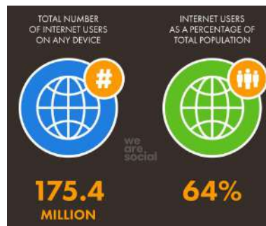
Gambar 1. Penggunaan Internet di Indonesia pada tahun 2020

Perkembangan teknologi terutama internet telah mengubah cara orang untuk beriklan. Internet menjadi faktor munculnya model periklanan baru yaitu pemasaran digital ( digital marketing ). Digital marketing adalah sebuah strategi pemasaran yang memanfaatkan media digital, seperti website , smartphone , email , blog , dan social media [3]. Iklan digital dapat ditujukan kepada konsumen yang tertarik pada produk atau layanan tertentu. Pelanggan dapat mengambil manfaat dari iklan yang menargetkan minat pribadi mereka, mengurangi iklan yang tidak relevan dan mengurangi waktu yang dibutuhkan untuk menemukan produk [2]. Pengetahuan tentang konsumen juga dibutuhkan oleh perusahaan agar dapat mengiklankan produk yang tepat kepada konsumen yang tepat.