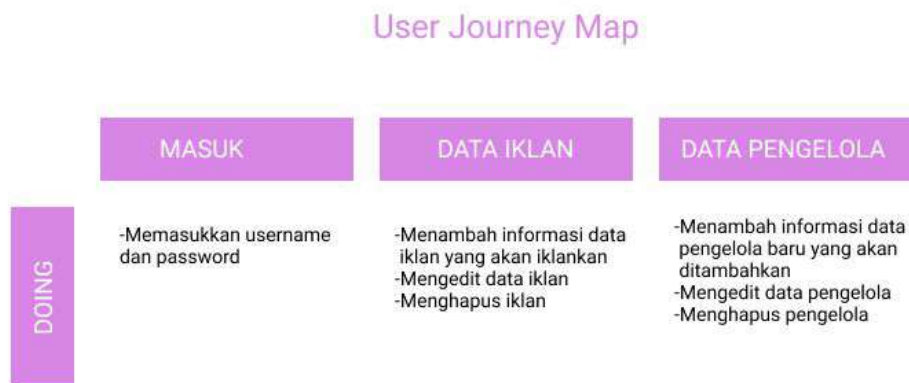
Gambar 4. User Journey Map

User Journey Map menjelaskan proses, jalur, atau urutan melalui mana pengguna mengakses atau menggunakan layanan untuk menyelesaikan tugas atau tujuan [9]. Tujuan dari user journey map adalah untuk mengetahui cara pengguna pengguna berinteraksi dengan website dan dapat mempengaruhi perancangan desain dari website yang akan dibuat [10]. Pengguna yang akan menggunakan website ini adalah orang-orang yang memiliki usaha atau perusahaan dan ingin memiliki sistem sendiri untuk mengiklankan produk mereka. Berikut merupakan User Journey Map yang dibuat untuk website Adboard: