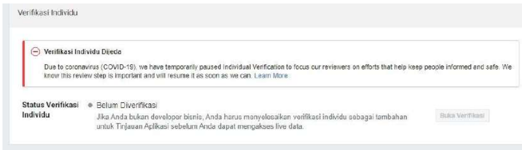
Gambar 5. Facebook menutup verifikasi individu

Dikarenakan adanya wabah Covid-19 Facebook sebagai penyedia akses API untuk melakukan periklanan pada social media Facebook dan Instagram menutup akses verifikasi mandiri sehingga menyebabkan kami untuk merubah sistem yang semula menggunakan kedua social media tersebut menjadi menggunakan website . Berikut adalah bukti dari penutupan akses tersebut.