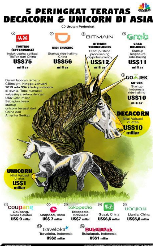
Gambar 1. 3 Data 5 Peringkat Teratas Decacorn dan Unicorn di Asia Menurut CNBC Indonesia