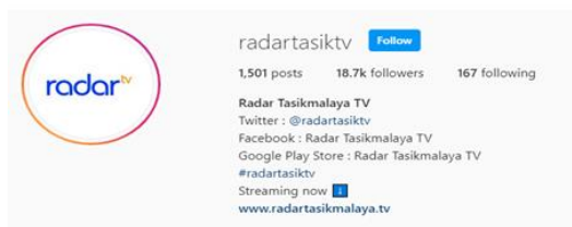
Tampilan Instagram Radar TV