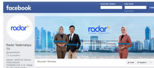
Tampilan Facebook Radar TV