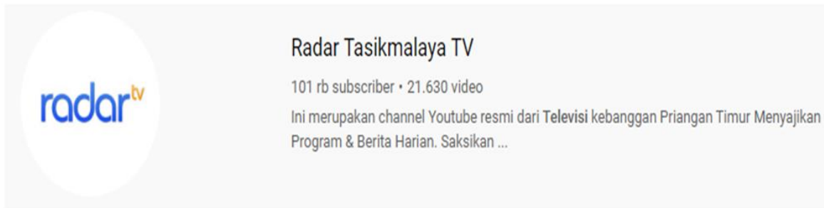
Tampilan Youtube ChaNnel Radar TV