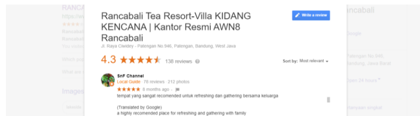
Gambar 1.1 Rancabali Tea Valley

Menurut hasil review yang penulis temukan dari ulasan google, tempat ini memiliki poin review 4,3/5. Dari berbagai komentar orang yang pernah berkunjung ke sana, benar saja mereka menyarankan bahwa Rancabali ini adalah tempat yang cocok untuk berlibur bersama dengan keluarga.