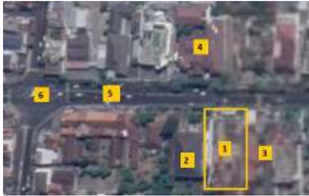
Gambar 1.1 – Lokasi Bangunan

Lokasi pembangunan gedung baru kantor OJK Yogyakarta terletak di Jalan Jenderal Sudirman No. 32, Yogyakarta. Di mana pada saat ini kantor OJK masih menempati bangunan gedung sewa.