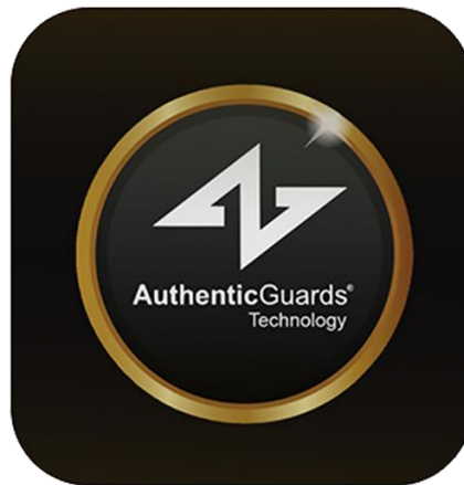
GAMBAR 1.1 Logo Perusahaan

Perusahaan Authentic Guards Technology area Bandung merupakan perusahaan startup yang terletak di Jl. Pasirluyu VII No.7, Ancol, Kec. Regol, Kota Bandung. Berdasarkan hasil observasi yang dilakukan oleh peneliti, perusahaan ini menyediakan aplikasi berupa sistem scanning QR code untuk mengautentikasi suatu produk. Perusahaan ini buka setiap hari senin sampai jumat, buka jam 09.00-21.00 WIB. Sedangkan hari sabtu dan minggu tutup. Apabila ingin mengetahui informasi lebih lanjut seputar produk, harga dan lain sebagainya dapat menghubungi melalui nomor telepon 0817-1717-4113.