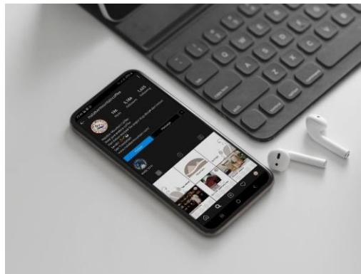
Gambar 1 Media Sosial

Konsep media pada perancangan ini berdasarkan kuesioner dan wawancara pada yang telah didapat. Media yang akan digunakan yaitu identitas visual dan media promosi yaitu media sosial dan media cetak untuk meningkatkan promosi dan pesan dapat tercapai ke khalayak sasaran pada perancangan strategi komunikasi merek coffeeshop Malabar Mountain Coffee. Media sosial yang akan digunakan adalah media sosial instagram, facebook, dan twitter, karena pengguna dari media sosial tersebut aktif dan seluruh orang baik remaja, dan orangtua dapat menggunakannya. Media sosial ini akan memuat informasi – informasi seputar produk dari usaha coffeeshop Malabar Mountain Coffee.