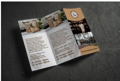
Gambar 4 Brosur