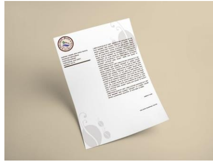
Gambar 8 Kop Surat