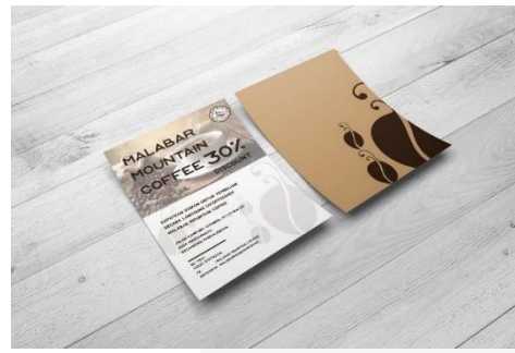
Gambar 5 Flyer