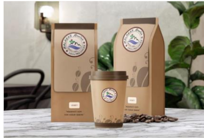
Gambar 11 Packaging