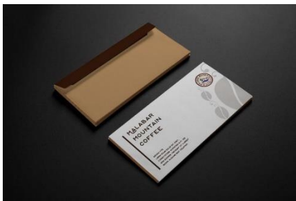
Gambar 9 Amplop