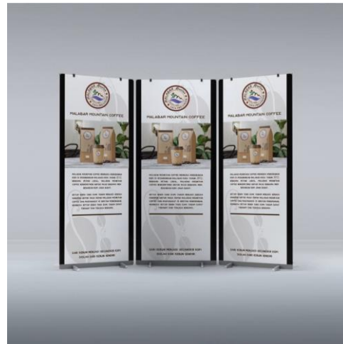
Gambar 3 X-Banner