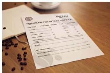
Gambar 6 Menu Produk

Selain itu dirancang juga untuk kebutuhan usaha Malabar Mountain Coffee seperti daftar menu, kartu nama, kop surat, amplop, dan packaging untuk kebutuhan dan identitas Malabar Mountain Coffee.