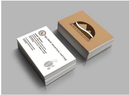
Gambar 7 Kartu Nama