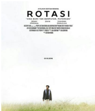
Gambar 2 Tangkapan layar film Rotasi(2016)

Sinopsis : Aurora adalah seorang siswi SMA yang sedang dilanda asmara di sebuah gubuk tua dengan teman cowoknya, Dewa. Mereka yang sedang mengalami mabuk asmara tidak sengaja melakukan hal terlarang di luar nikah. Namun, segala hal yang sudah terlanjur harus mereka hadapi terutama dengan permasalahan keluarga mereka yang rumit.