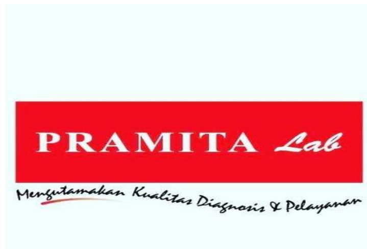
Gambar 1. 2 Logo Perusahaan

Berikut ini adalah logo dari Pramita Lab: