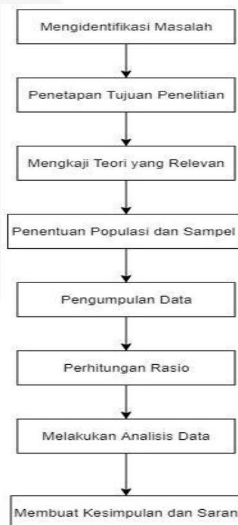
Gambar 2 Tahapan Penelitian

Analisis lebih lanjut diperlukan pada faktor-faktor yang mempengaruhi harga saham untuk menghindari kerugian dalam investasi saham. Tahapan berikut dilakukan untuk membentuk Komponen Utama.