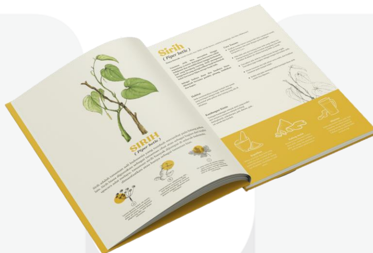
Gambar 1. Contoh Mockup Isi Buku

Media utama berupa buku yang akan dicetak pada kertas Bookpaper berukuran A5 sebanyak 22 lembar dua sisi fullcolor. Buku di jilid perfect binding dengan sampul soft cover dengan Spot UV di ilustrasi dan judul utama. Berikut tampilan buku yang sudah dirancang: