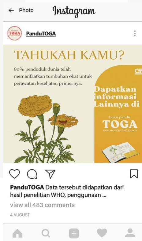
Gambar 5. Mockup Social Media Promotion