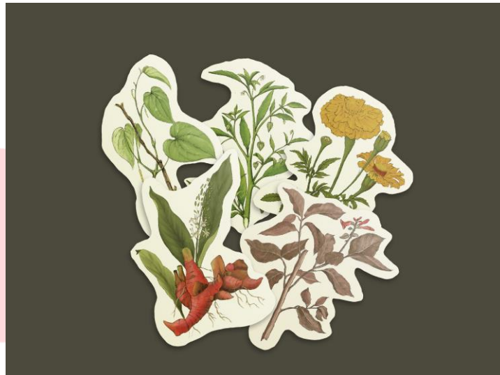
Gambar 8. Stiker Tanaman Obat