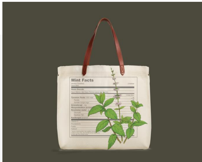
Gambar 9. Totebag Tanaman Obat