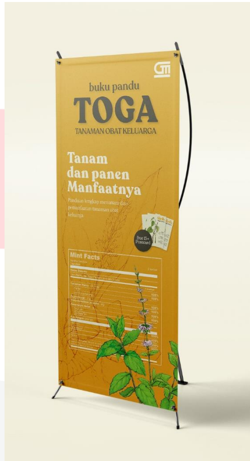
Gambar 4. X-Banner