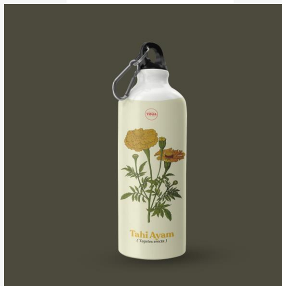
Gambar 7. Tumblr Tanaman Obat