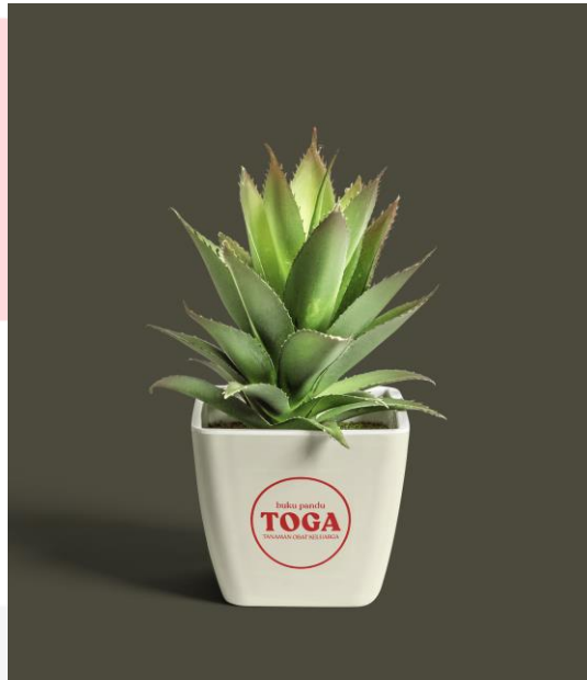
Gambar 6. Pot Tanaman Obat

Merchandise merupakan buah tangan yang bisa didapatkan oleh pembeli buku untuk mengingatkan mereka tentang produk yang dibelinya. Selain itu merchandise diharapkan memantu promosi dan melaksanakan tujuan dari kampanye yang dijalankan.