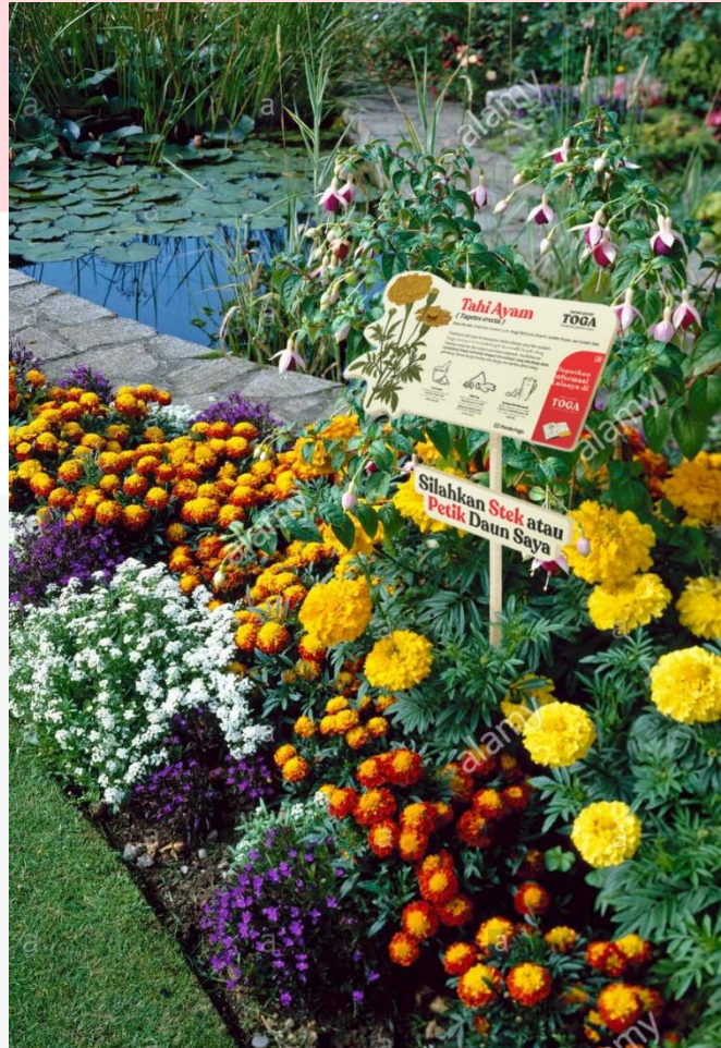
Gambar 3. Mockup Sigange Taman

Akan ada 3 media pendukung yang membantu promosi dan penyebaran informasi mengenai buku panduan Tanaman Obat Keluarga (TOGA). Semua media pendukung melibatkan audiens untuk berinteraksi dan memberikan informasi bermanfaat, sebagaimana menurut Siswanto dan Dolah (2019) bukan hanya logo yang menjadi media utama tetapi bagaimana suatu brand bisa memberikan unsur lainnya yang lebih manusiawi. berikut media pendukung yang digunakan: