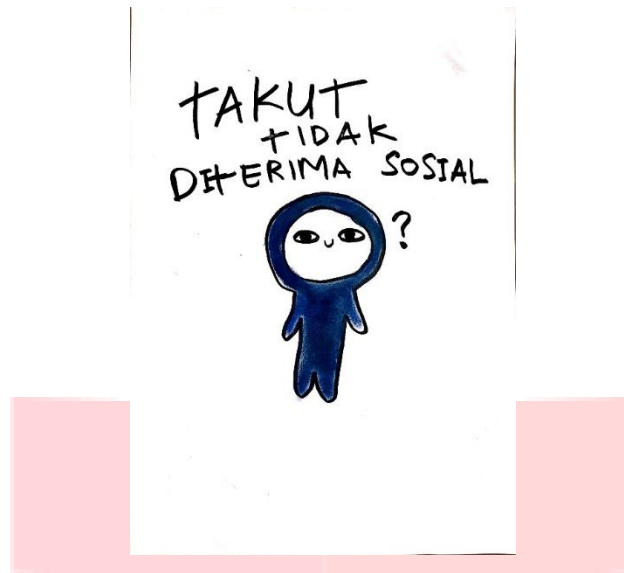
Judul : takut tidak diterima sosial. Medium : Mixmedia diatas Kertas. Ukuran : A3.

Kenaifan penulis akan sosial serta ketakutan penulis akan penolakan dalam sosial menjadi hambatan penulis untuk bergerak maju. Meskipun penulis sudah mendapatkan dukungan dalam bersosial namun kecemasan akan penolakan dilingkup sosial masih tetap membekas dan sering tidak terkendali.