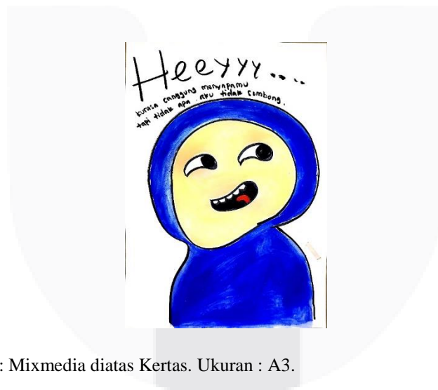
Judul : hey. Medium : Mixmedia diatas Kertas. Ukuran : A3.

Kesalahpahaman sering terjadi hanya karena karakter penulis yang pendiam, kata sombong sering didapatkan untuk menggambarkan karakter penulis oleh orang lain. Namun masalah pribadi penulis untuk berinteraksi dengan orang lain membuat penulis merasa canggung untuk memulai hal-hal kecil seperti sekedar menyapa.