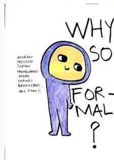
Gambar 12 Karya "why so formal"