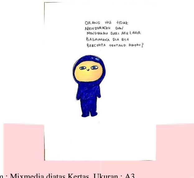
Judul : sotoy. Medium : Mixmedia diatas Kertas. Ukuran : A3.

Sering kali penulis mendapatkan pandangan-pandangan dari orang lain tentang diri yang dirasa tidak masuk akal atau hanya prediksi.