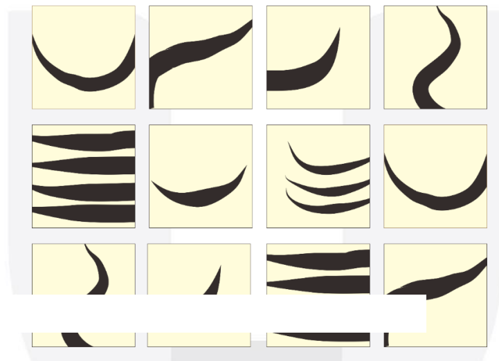
Gambar . 2 modul karya digita dan proses studi bentuk

dari modul modul tersebut, penulis coba Kembali olah dan memilih bentuk mana yang paling esensial bagi penulis.