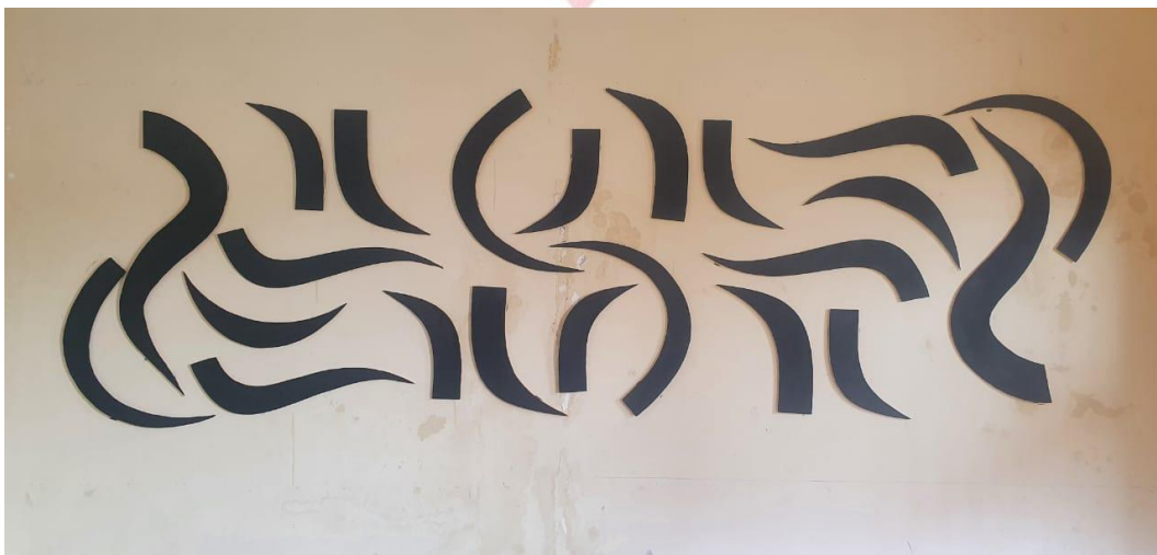
Gambar . 5 karya final