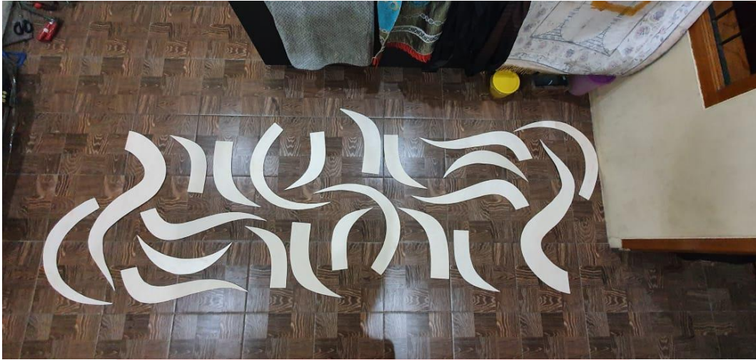
Gambar . 4 Preview karya yang sudah dipotong