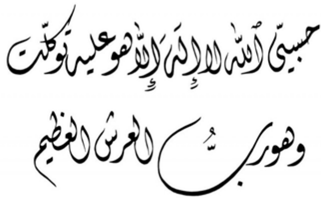
Gambar . 1 khot diwani

Tulisan khot memang sangat dekat dengan islam karena fungsinya untuk menulis tulisan indah untuk Al-Qur'an khususnya. Dalam hal ini muncul kembali ingatan lain penulis ketika mempelajari kaligrafi tersebut di pesantren. Ini juga merupakan pengalaman artistik hal lain yang penulis alami. Dengan bentuk – bentuk tersebut penulis mencoba mengambil sisipan islam yaitu dengan tidak menggambarkan makhluk hidup khususnya dikarya yang penulis buat ini.