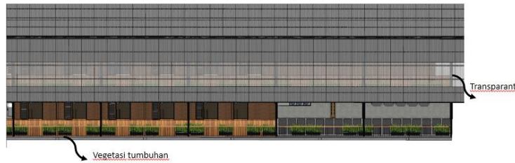
Gambar 4.2 Konsep aplikasi layout