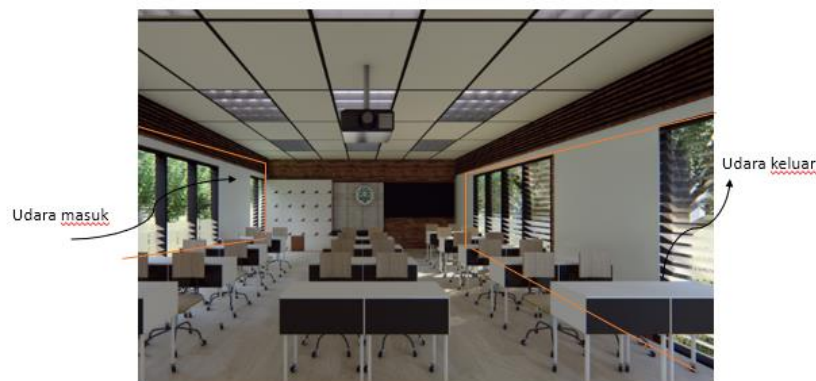
Gambar 4.10 Konsep penghawaan ruang kelas

Menggunakan penghawaan dan pencahayaan alami dalam dilihat ruang kelas memiliki bukaan jendela didua sisi sehingga udara keluar masuk dengan optimal.