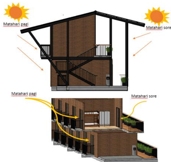
Gambar 4.4 Konsep pencahayaan