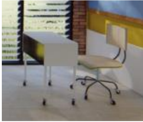
Gambar 4.16 Meja dan kursi ruang kelas