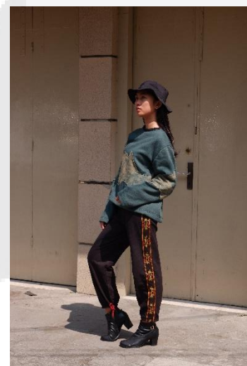
Gambar 7. Visualisasi Rancangan1

Berikut merupakan visualisasi dari kedua produk dan detail dari sketsa yang direalisasikan: