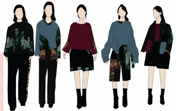
Gambar 6. Eksplorasi Terpilih Dok.