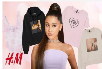
Gambar 1. Ariana Grande X H&M

Lalu H&M pada tahun 2019 berkolaborasi dengan penyanyi Ariana Grande dengan membuat capsule collection , yang terinspirasi dari lirik lagu dan sampul album ke empat Ariana (Utami, 2019).