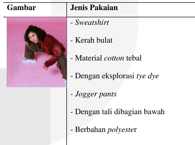
Tabel 1. Busana Oscar Lolang

Pada bagian ini penulis melakukan beberapa tahap yaitu eksplorasi dan penerapan SCAMPER. Dalam eksplorasi desain, penulis melakukan tahapan seperti mengetahui terlebih dahulu bentuk pakaian dari musisi indie folk yang berasal dari Bandung yaitu, Oscar Lolang. Untuk menemukan bentuk sebelum menuju tahap eksplorasi desain.