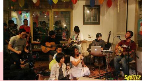
Gambar 2. Suasana Gigs di Kineruku

Kineruku merupakan perpustakaan yang menyediakan referensi seputar buku, musik, dan film di Bandung yang memiliki visi “Berbagi referensi yang saya punya”. Kineruku merangkul dan mempersilakan pemustaka datang seperti memasuki rumahnya sendiri, nama Kineruku berasal dari kata “Kine” yang berarti Cinematic (Sinema) dan “Ruku” singkatan dari rumah buku. Gabungan kata “Kine” dan “Ruku” menjadi “Kineruku” (Rohanah & Agustina, 2018). Selain itu Kineruku juga mengadakan acara seperti musik akustik, bedah buku dan launching buku (Minati, 2017).