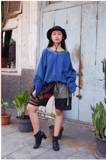
Gambar 8. Visualisasi Rancangan2 Dok. Pribadi, 2020