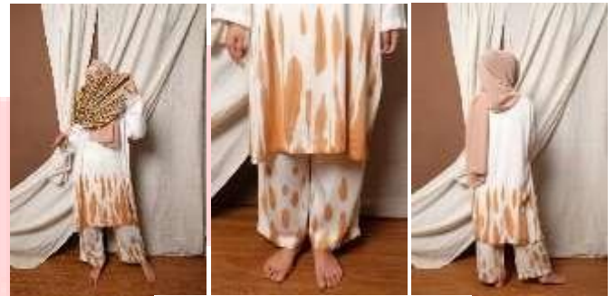
Gambar 15 Visualisasi Produk Look 1