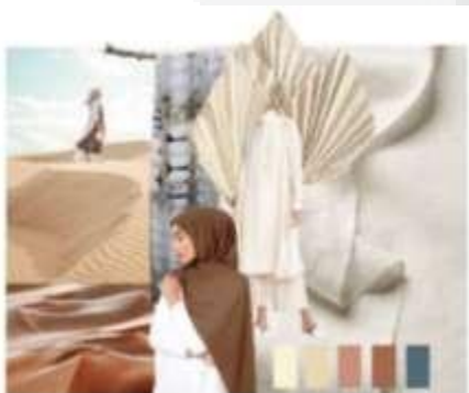
Gambar 1 Konsep Moodboard

Penulis merancang busana leisure wear khusus untuk wanita berhijab, dengan potongan busana loose shape bertujuan agar tidak membentuk tubuh dan