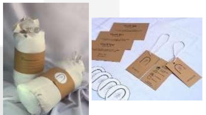
Gambar 17 Visualisasi Merchandise