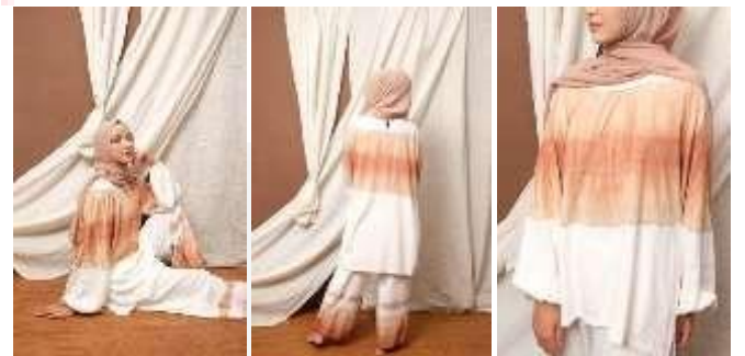
Gambar 16 Visualisasi Produk Look 3