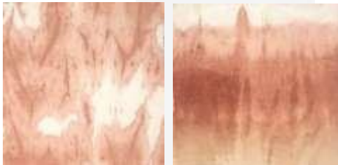
Gambar 2 Motif Terpilih

Pada proses perancangan, penulis melakukan eksplorasi awal berupa kain dengan menggunakan teknik ikat celup dengan pewarnaan alam untuk membuat motif yang terinspirasi dari pasir pantai Oetune. Dari keenam hasil eksplorasi awal maka penulis memilih dua motif berdasarkan pertimbangan teknik dari masing – masing dan motif yang dihasilkan sesuai dengan konsep yang terinspirasi dari pantai Oetune. Pasir pantai yang menjadi fokus utama dalam pembuatan motif, dengan memodifikasi warna dan mengadaptasi tekstur dari pasir tersebut. Lalu dari ketiga motif akan diterapkan pada desain terpilih dengan variasi dan kesan yang berbeda-beda.