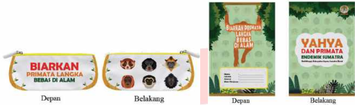
Kotak Pensil & Buku Tulis