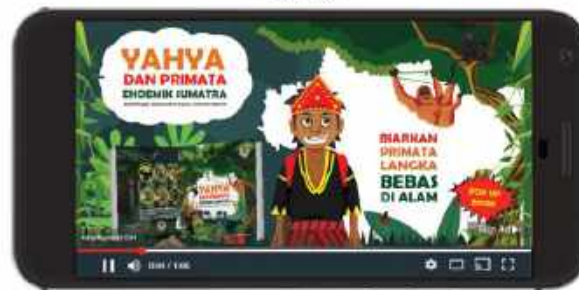
Iklan di Media Sosial