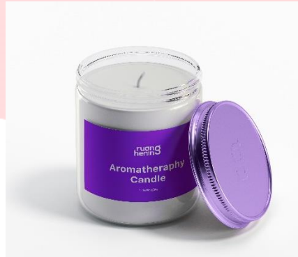
Gambar 4 Merchandise

Selain media pendukung, ada merchandise yang dapat digunakan sebagai media promosi.