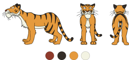
Gambar 2. Karakter harimau.