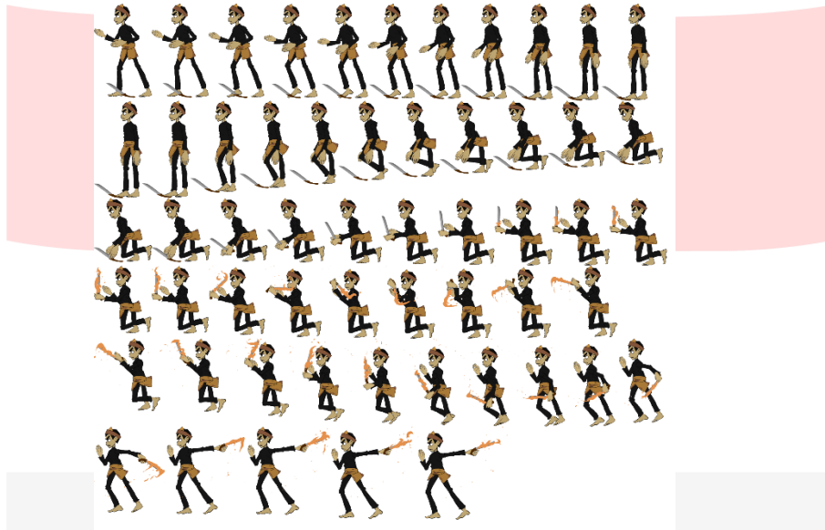
Gambar Sprite Sheet Mengambil Golok