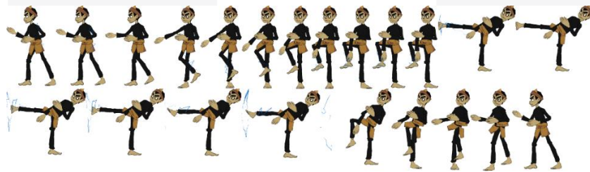
Gambar sprite sheet Tendangan T