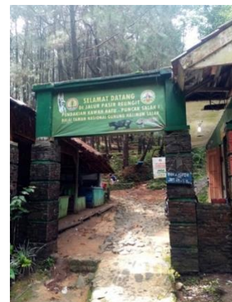
Gambar1.1 Kawasan wisata di kecamatan pamijahan

Oleh karena itu banyak wisatawan yang datang dari berbagai daerah terutama masyarakat Bogor itu sendiri yang banyak yang penasaran dengan tempat wisata alam yang