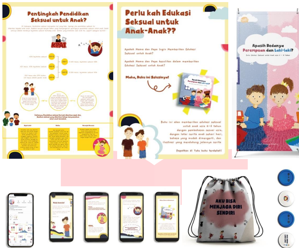
Gambar 3.2 Media Pendukung