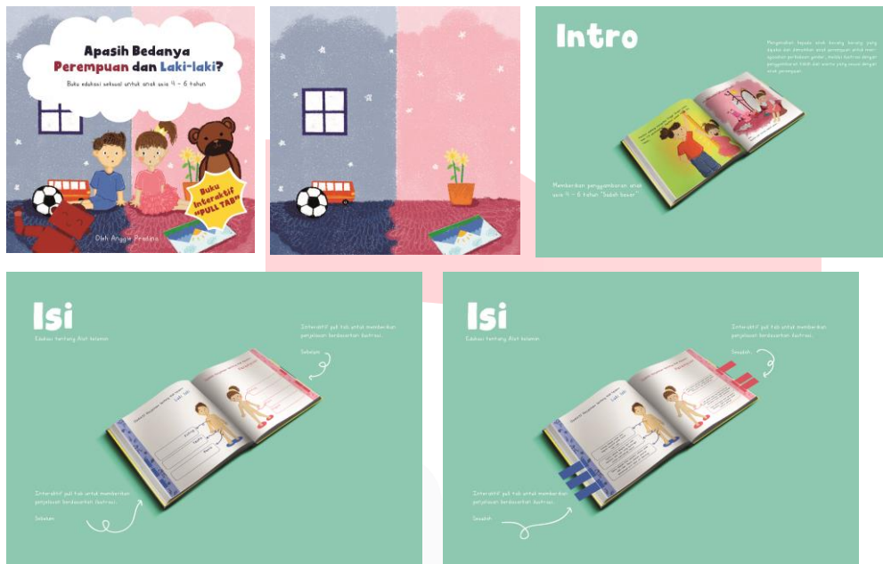
Gambar 3.1 Cover dan sebagian isi buku