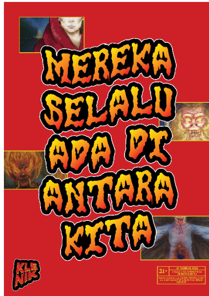
Gambar 9 Poster Klenik