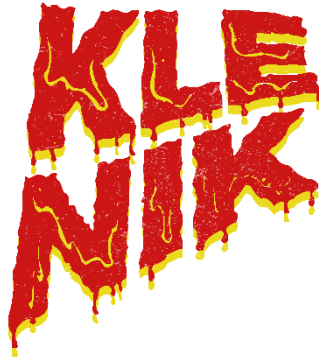
Gambar 1 Logo