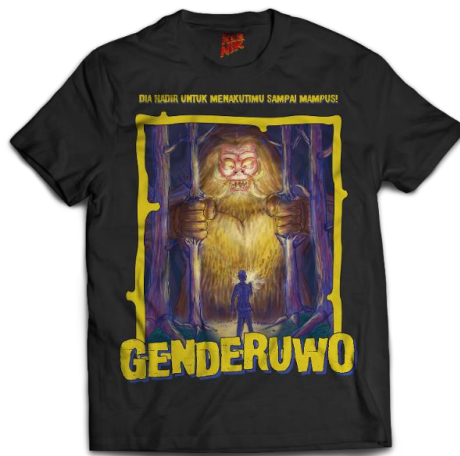
Gambar 5 Bagian Depan Contoh Kaus Klenik, Genderuwo ( Sumber : Muhammad Athariq Fauzan, 2020)