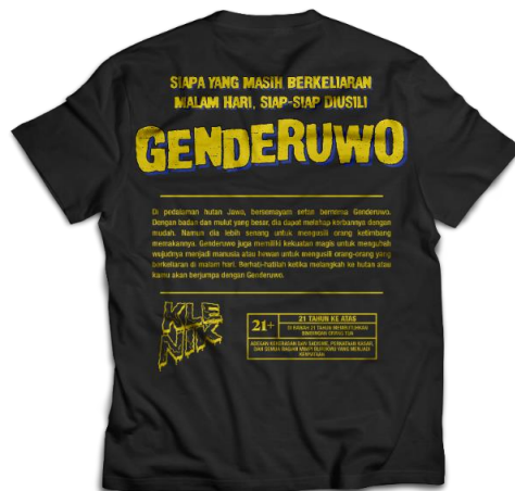
Gambar 6 Bagian Belakang Contoh Kaus Klenik, Genderuwo