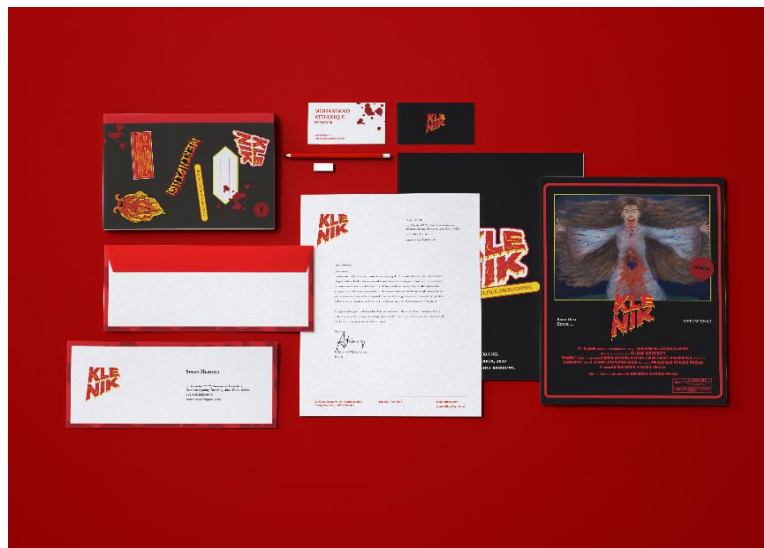
Gambar 10 Stationery Set Klenik