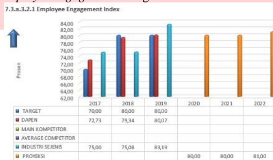
Gambar 1. Employee Engagement Index Tahun 2017 – 2019

Dana Pensiun Telkom adalah badan hukum berupa dana pensiun pemberi kerja (DPPK) yang menyelenggarakan program pensiun manfaat pasti bagi karyawan Telkom. Pada Dana Pensiun kepuasan atau ketidakpuasan kerja karyawan dapat dilihat dari harapan tiap - tiap karyawan dengan kenyataan pada perusahaan. Kepuasan kerja sering kali dihubungkan dengan employee engagement . Employee engagement atau keterikatan karyawan merupakan suatu kondisi, sikap atau perilaku positif seorang karyawan terhadap pekerjaannya. Hal tersebut dibuktikan dengan penelitian yang dilakukan oleh beberapa ahli. Penelitian yang dilakukan oleh Vorina et al (2017) yang menunjukkan bahwa hubungan antara employee engagement dan kepuasan kerja adalah positif dan signifikan secara statistik, sehingga jika employee engagement meningkat maka nilai kepuasan kerja juga akan meningkat. Berdasarkan variabel kepuasan kerja Dana Pensiun Telkom, peneliti menggunakan data employee engagement sebagai berikut: