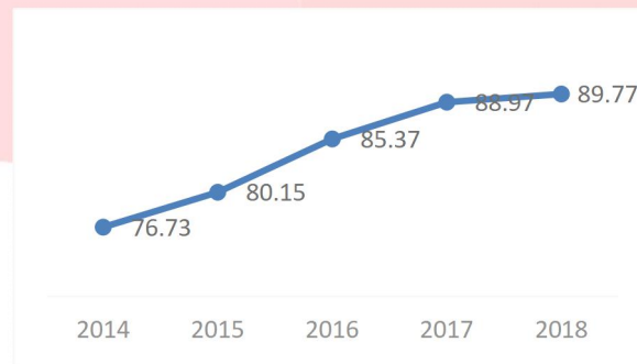
Gambar 1 Hasil Assesmen GCG Perum Bulog

Salah satu perusahaan Badan Usaha Milik Negara yang telah menerapkan GCG yaitu Perusahaan Umum Bulog. Perum Bulog merupakan lembaga pangan Indonesia yang bergerak dibidang logistik pangan. Sebagai bentuk tanggungjawab, Perum Bulog memiliki komitmen tinggi untuk menerapkan prinsip-prinsip GCG secara konsisten. Tata kelola yang baik dapat meningkatkan kinerja dan keunggulan daya saing berkelanjutan, sehingga dengan menerapkan GCG menjadi nilai tambah yang sangat penting bagi Perum Bulog, seiring bertambahnya harapan para pemangku kepentingan terhadap kinerja perusahaan. Hasil penerapan GCG pada Perum Bulog dapat dilihat pada gambar 1 berikut.