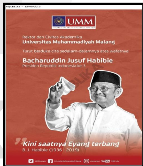
Gambar 1. 1 Iklan Dukacita Habibie pada Koran Republika

dukacita dengan desain terbaik mereka untuk Habibie. Namun, disamping menampilkan desain terbaik mereka, publik lebih tertuju kepada salah satu foto Habibie dengan mengenakan baju koko warna putih, mengenakan peci hitam, dan menerbangkan sebuah pesawat kertas. Habibie memegang pesawat kertas karena semasa hidupnya dan sampai saat ini Beliau terkenal dan dijuluki sebagai Bapak Teknologi karena kepiawaiannya di bidang teknologi terutama dalam dunia penerbangan di Indonesia ( https://www.biografiku.com/ ). Iklan tersebut dapat dilihat seperti gambar dibawah ini.