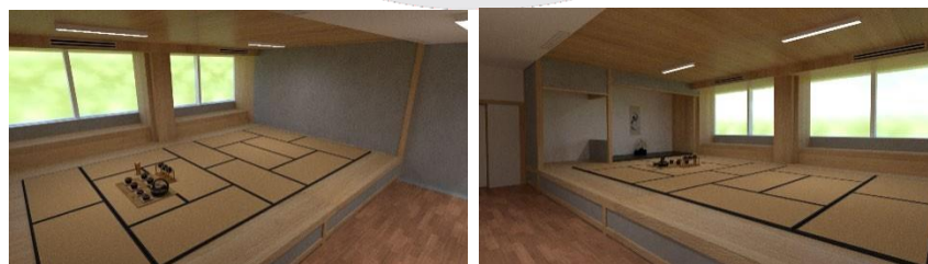
Gambar 5 Ruang Kelas Budaya

Ruang Kelas Kebudayaan memiliki konsep tea house dengan menciptakan suasana seperti berada di ruang tradisional Jepang.