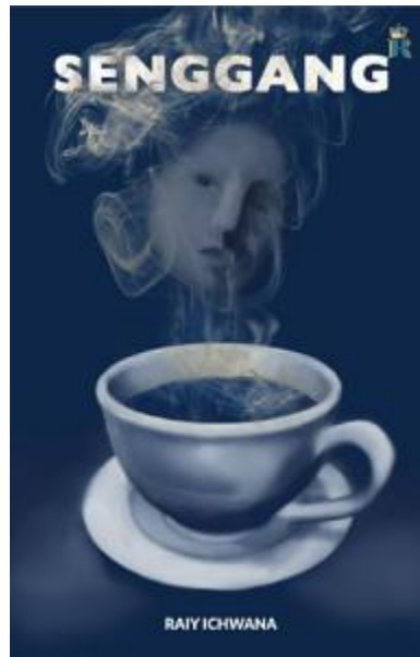
Gambar 1.1 Novel Senggang

Ichwana. Novel ini terinspirasi dari kehidupan nyata penulis novel dan digabungkan dengan beberapa cerita fiktif yang menjadi daya tarik untuk menganalisis novel tersebut.