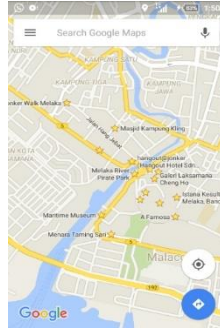
Gambar II-2 Google Maps