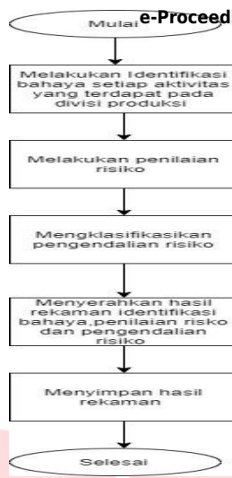
Gambar V. 1 Urutan Proses