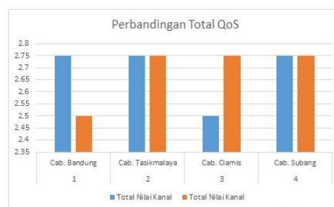
Gambar 7 Perbandingan Total

Dari hasil analisis kanal yang dibuat didapatkan hasil yang cukup dari kedua kanal yang disimulasikan, dan kanal VPN yang dibuat dapat berjalan dengan cukup baik serta lancar. Dimana hasil dari kanal yang dibuat dari beberapa kantor cabang bisa digunakan meskipun masih belum mendekati kata sangat baik tetapi kanal yang dibuat masih layak untuk digunakan.