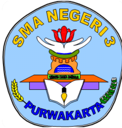
Gambar 1.1 Logo SMAN 3 Purwakarta

SMAN 3 Purwakarta merupakan salah satu sekolah menengah atas yang telah berdiri sejak lama, yaitu pada tahun 1987. SMAN 3 Purwakarta terdiri dari 50 orang guru.