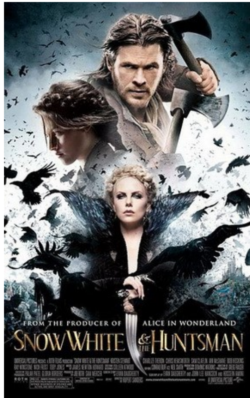
Poster Film Snow White and The Huntsman