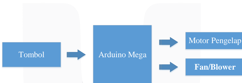
Gambar III- 2 Diagram Blok Pengering Mobil otomatis

Pada bab sebelumnya telah digambarkan blok diagram secara umum pada bab ini akan dijelaskan blok diagram sistem secara spesifik dapat di lihat pada gambar dan penjelasan di bawah ini.