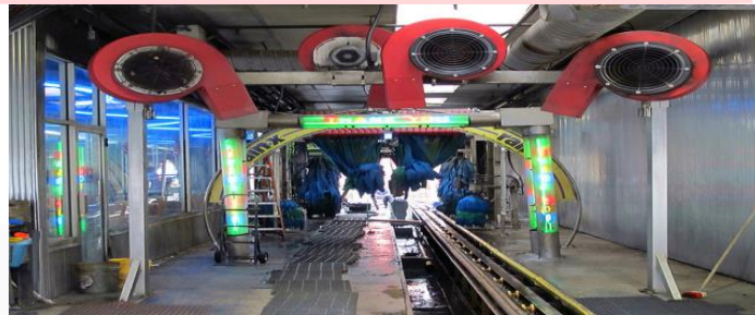
Gambar II- 1 Salah Satu Proses Pengering Mobil

Sistem pengering pada sistem pencuci mobil otomatis adalah Sistem pengeringan yang terdiri dari sepasang alat pengering vertikal stasioner dan pengering horisontal bergerak yang dapat menyesuaikan diri dengan kontur kendaraan.