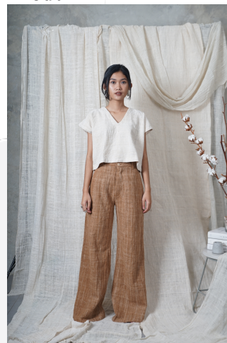
Gambar Looks 1