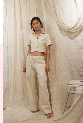
Gambar Looks 5