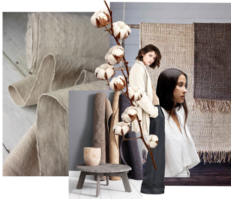
Gambar : Image Board