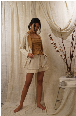
Gambar Looks 3