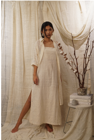
Gambar Looks 2