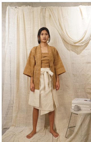
Gambar Looks 4