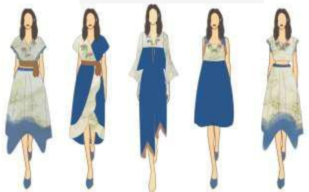
Gambar 5. Sketsa

Desain pada koleksi ini terdiri dari produk pakaian berupa blus, dress, celana, dan rok. Berikut merupakan sketsa desain: