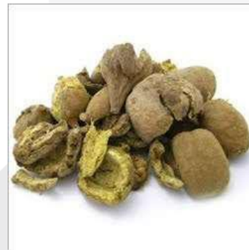
Gambar 2. Jelawe