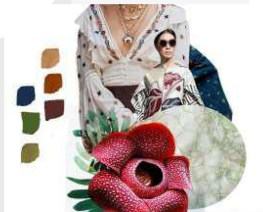
Gambar 4. Moodboard

Perancangan ini dilakukan berdasarkan tingginya potensi industri kreatif Indonesia pada bidang fesyen dan tekstil dengan himbuan penggunaan pewarna alam karena potensi yang dimilikinya. Penggunaan pewarna alam merupakan sebuah pemanfaatan sumber daya alam yang melimpah, mengingat Indonesia memiliki banyak sumber pewarna alam (Ansori, 2014). Selain itu pewarna alam juga memiliki daya tarik tersendiri karena menghasilkan warna khas juga memiliki faktor tradisi dan nilai kerajinan tangan.