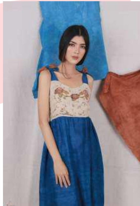
Gambar 8. Foto Produk 3