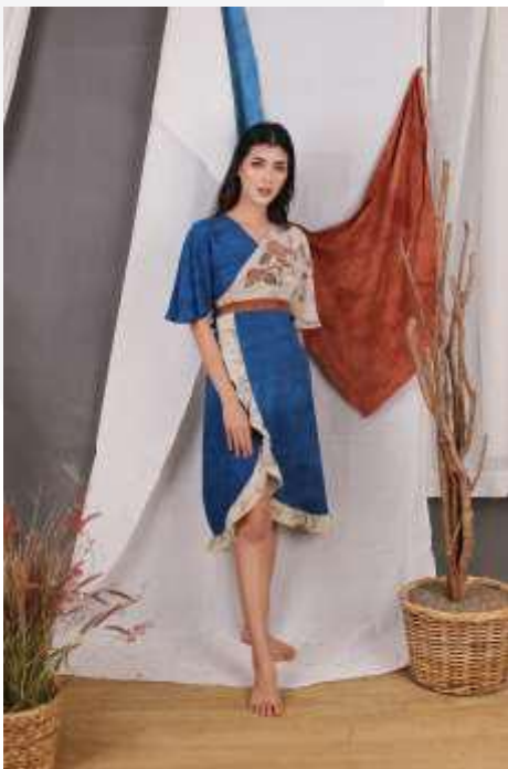
Gambar 7. Foto Produk 2