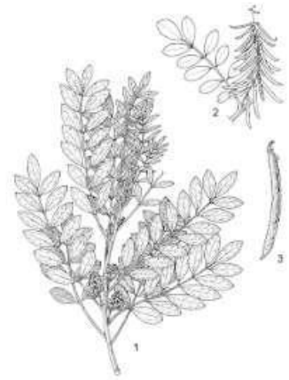
Gambar 1. Indigofera Tinctoria

Zat warna bejana merupakan zat warna yang paling terkenal dan paling tua didunia, zat warna ini mewarnai serat berdasarkan reaksi reduksi oksidasi (redoks), jenis zat warna ini memiliki ketahanan warna yang unggul dibandingkan zat pewarna lainnya.