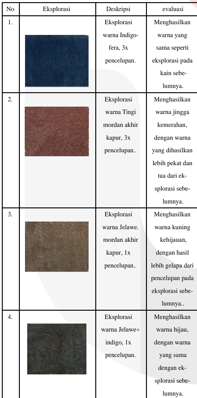
Table 1. Tabel Eksplorasi Warna