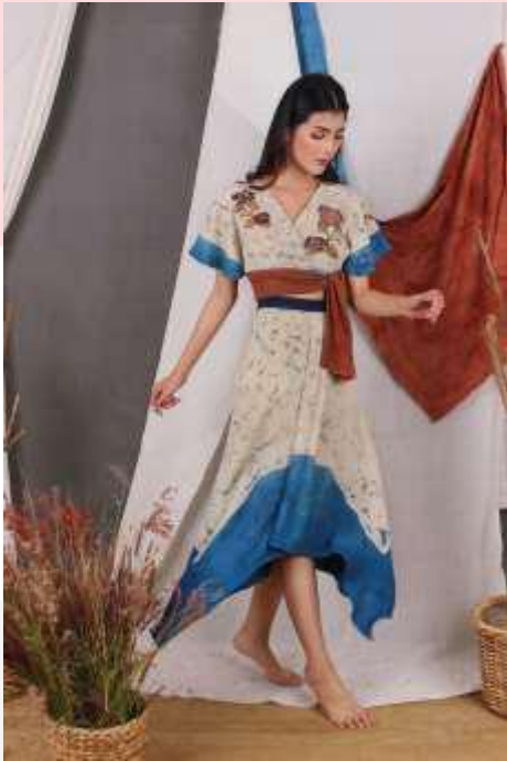
Gambar 6. Foto Produk 1

Berikut merupakan hasil produk yang telah dibuat: