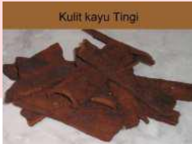
Gambar 3. Kulit Kayu Tingi