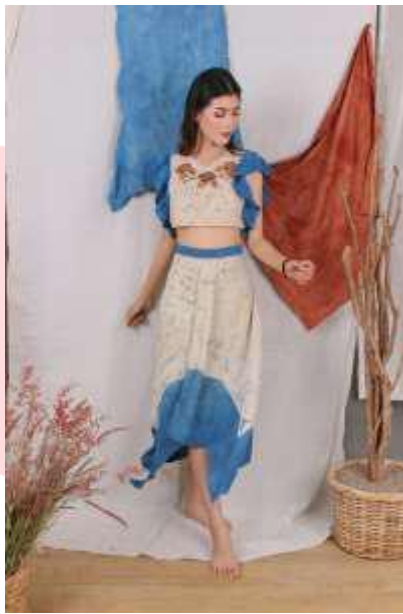
Gambar 9. Foto Produk 5