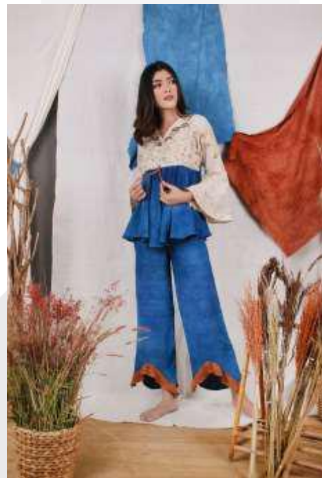
Gambar 9. Foto Produk 4