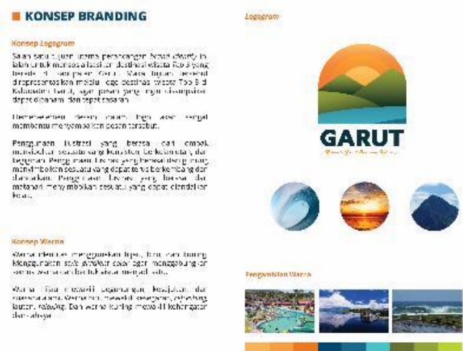
Gambar 2. Konsep Branding

Dalam proses ide untuk perancangan logo menggunakan bentuk dari ombak, gunung, dan matahari yang dikombinasi. Pemilihan elemen ini selain menggambarkan keindahan destinasi wisata Top 3 juga mengandung maksud tersendiri seperti, penggunaan ombak menyimbolkan sesuatu yang konsisten, berkelanjutan, dan kegigihan. Penggunaan gunung untuk menyimbolkan sesuatu yang dapat terus berkembang. Terakhir penggunaan matahari menyimbolkan sesuatu yang dapat diandalkan.