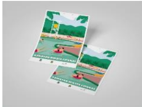
Gambar 4. Flyer Cipanas