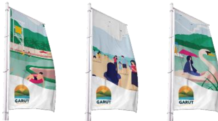
Gambar 6. Umbul-umbul Top 3