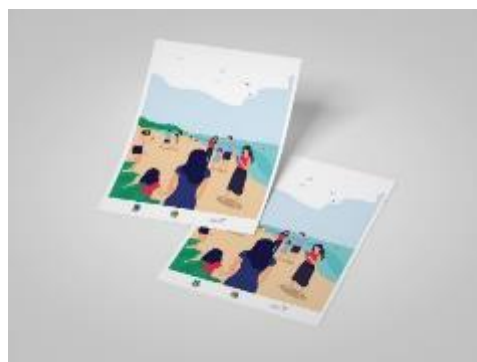
Gambar 5. Flyer Pantai Sayang Heulang [Sumber, Wulandari 2019:57]