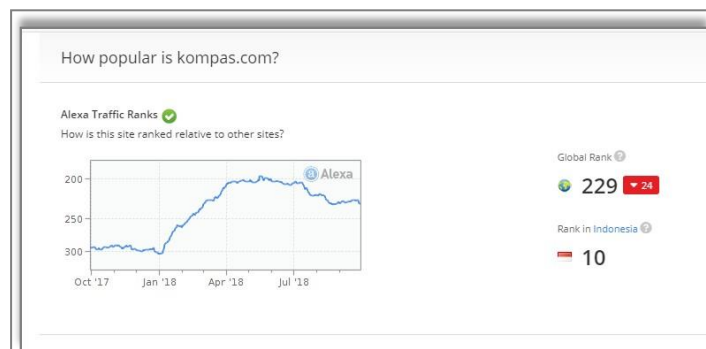
Gambar 1.2 Peringkat Kompas.com di Alexa per tanggal 29 September 2018